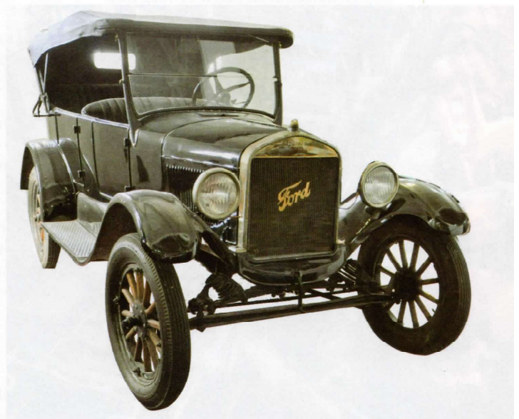
Imagen de uno de los primeros modelos de auto Ford elaborados a través de una línea de montaje en la primera mitad del siglo XX.

cadena, es decir, la organización de la producción en serie mediante una cadena de montaje. Consistía en la introducción de nuevas máquinas-herramientas que realizaban la mayoría de las operaciones ejecutadas por obreros y la conexión de todo el proceso de elaboración a través de una cinta transportadora que llevaba