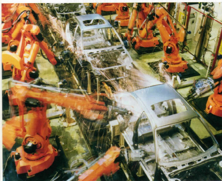
El armado de automóviles por robots permite advertir el beneficio de los avances tecnológicos que reemplazaron al hombre en las tareas pesadas y riesgosas.

las ideas de John Keynes, economista inglés que proponía la intervención del Estado como regulador del sistema económico. El Estado se convirtió en el actor institucional más importante desde un punto de vista económico y social.